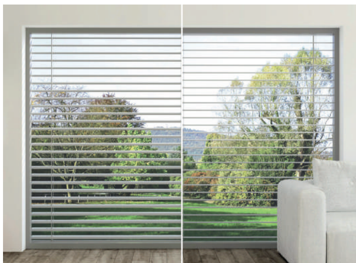
Estore Exterior orientável Standard